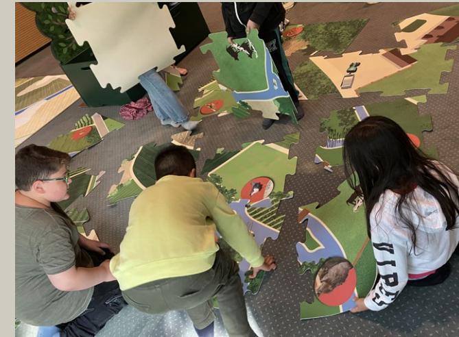
Beim Bodenpuzzle wird der Fluss in die Landschaft eingebettet